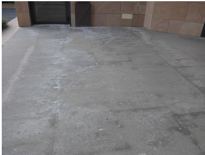
Sopralluogo 22032017 ingresso pedonale Viale Innovazione 22

STUDIO JAM ARCHITECTURE jACOPO MUZIO architetto - via gherardini 6 - 20145 MILANO - TF +39.02.39563201 p.iva: 03669480968 - n. ordine architetti milano: I4856 - studiomzj@gmail.com